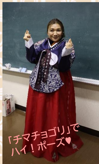
「チマチョゴリ」で ハイ!ポーズ♥