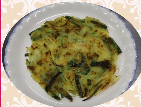
▲韓国風お好み焼き「チヂミ」