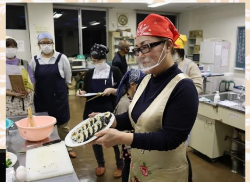
▲韓国風海苔巻き「キンバツ」 の完成で〜す(▽)/