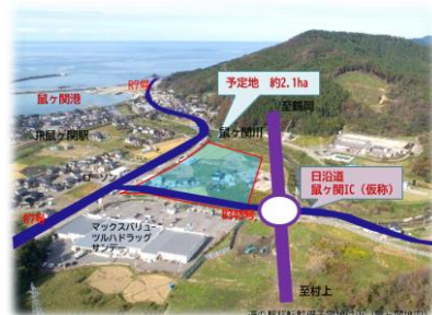
道の駅あつみ移転計画地

鶴岡市では、この道の駅移転整備を核とするこれからの拠点づくりに向け、持続可能な地域づくりに取り組む地域や団体等の意識喚起と機運醸成のため、地域を活かし、地域活性化に繋げる「道の駅セミナー」を開催します