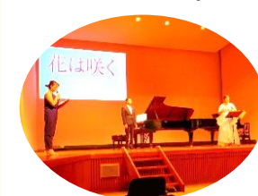
7/3(日)開催 「あつみの音楽好きのコンサート」

「あつみの音楽好きのコンサート」でお手伝いさせていただきました。迫力満点の和太鼓にゲストヴォーカリストを迎えてのギター演奏、圧巻の清涼のオペラ、優しい音色のフルートに心地よい旋律のピアノと、ジャンル盛りだくさん!どれもそれぞれ胸に響く音楽でしたし、何より演者皆さんがステージを楽しんでいるのが良く伝わってきました。スタッフとして関りながらこの素敵なひと時を共有させていただいた事にとっても感謝しています。