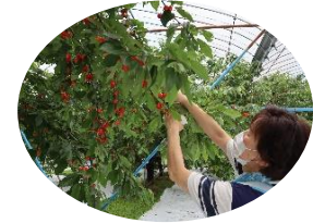
赤かぶ大学2022 第1回「温海川のさくらんぼ」 第5回「越沢の笹巻」

伝承～未来へつなぐあつみの食～をテーマに開催された「赤かぶ大学2022」の第1回「温海川のさくらんぼ」と最終回「越沢の笹巻」へお手伝いさせていただきました。温海川のさくらんぼでは園主さんのさくらんぼ栽培への想いが詰まった色々な品種を皆さんじっくりと味わいました。越沢の笹巻体験では講師の方々が付添い、指導を受け、悪戦苦闘しつつ笹巻を完成させていました。いつも受講生の皆さんが熱心に学び、地域の方たちとのコミュニケーションを通じてつながっていく縁。テーマと一緒に大切さを教えていただきました。