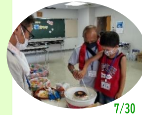
7/30(土)開催「子ども夏祭り」

3~4年前であればこの地区でも開催されていた夏祭り。コロナ禍でも子ども達に楽しんでもらいたく企画された夏祭り。スタッフお手製の当て、前日から必死に膨らませたヨーヨー等、マスク越しでも子どもたちの笑顔が、キラキラ輝く瞳が、スタッフにとって最高の賛辞。思うように大きくなれない綿あめ、でも自分で作ることが楽しく必死に頑張っている子どもたち。この光景がマスクや人数制限など必要としない、以前のような風景になり、もっとに賑やかに多くの子どもたちが安心して喜んでもらえるようになれば、沢山の笑顔が溢れて今年の夏はもっと素晴らしい夏祭りになると期待します。