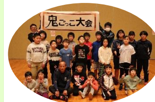
11/23(水・祝)開催「鬼ごっこ大会」

鬼ごっこは腰に付けたひもを取り合ういわゆるしっぽ取りをやりましたが、幼児から小学生まで約17名が参加してくれて、子供たちも思い切り走り回ることが出来て楽しかったです。子供たちと一緒に鬼ごっこをするのは私たちにとっても良い運動になりました(笑)