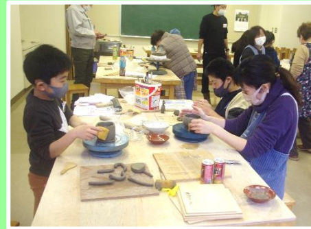
成形が完了した作品(焼く前)