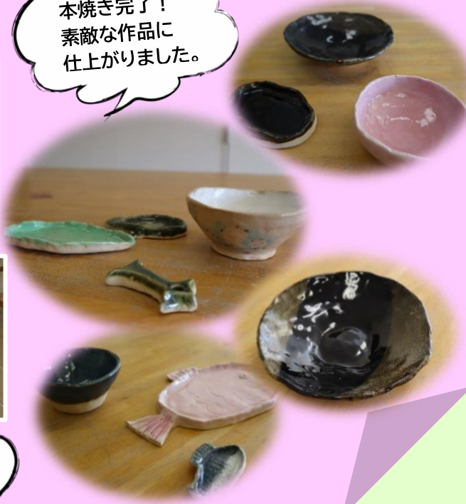
本焼き完了! 素敵な作品に仕上がりました。